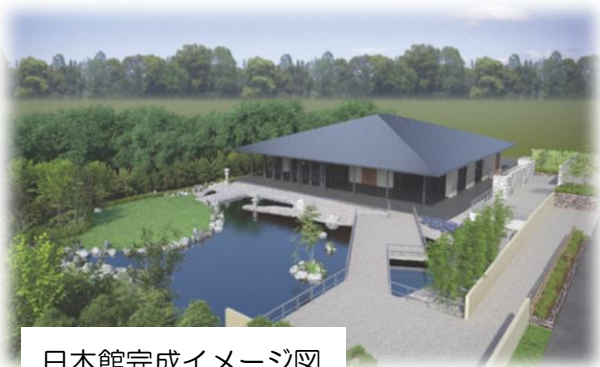
日本館完成イメージ図

本年4月から10月まで、中国・北京市において世界園芸博覧会が開催されます。中国は建国70周年の記念国家プロジェクトと位置付け、冬季五輪の会場予定エリアを開催地として準備が進んでいます。開催期間は半年で、国内外から1,600万人の来場者が予想されています。