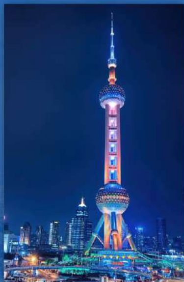
东方明珠电视塔 東方明珠テレビ塔