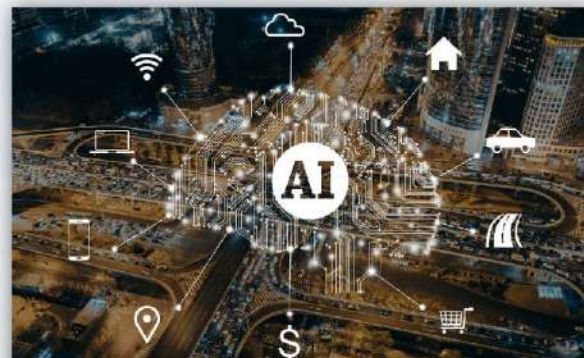
人工智能产业 人工知能産業

バイオ医薬の開発成果と高度な産業化に力を入れ、ハイエンドのライフヘルス医療機器プロジェクトの導入を強化し、薬品と医療機器産業のイノベーションが強い町を構築