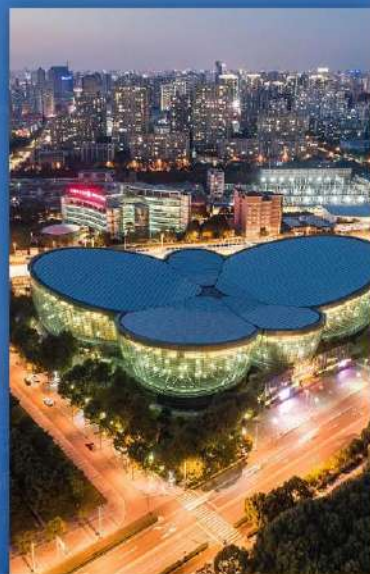
东方艺术中心 東方芸術中心