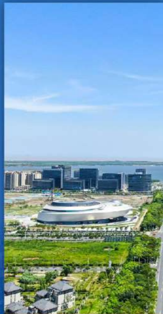
临港未来城 臨港未来シティ