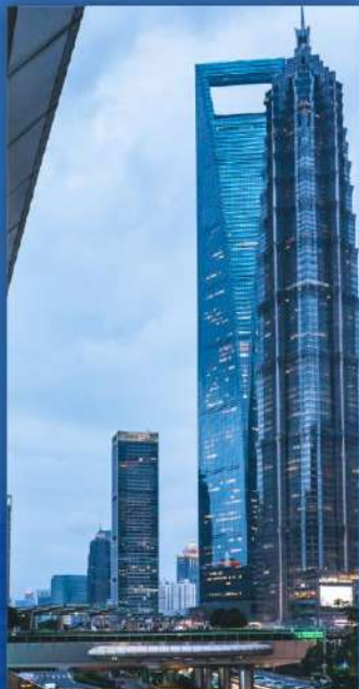
陆家嘴金融城 陸家嘴金融シティ