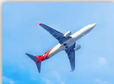
蓝天梦 航空と宇宙飛行

聚焦免疫治疗、基因治疗、干细胞治疗等现代生物治疗产品和新型疫苗、抗体、血液制品等重大生物制品研制 免疫療法・遺伝子治療・幹細胞治療などの現代バイオ治療製品および新型ワクチン・抗体・血液製剤などの重要バイオ製品の開発に焦点を当てる