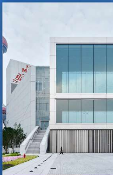
浦东美术馆 浦東美術館