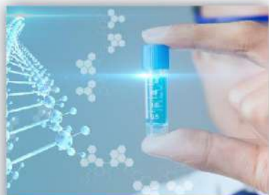
创新药 バイオ医薬

聚焦芯片设计, 着力提高新一代通信技术、人工智能、物联网、汽车电子等新兴主流芯片研发能力 チップ設計に焦点を当て、次世代通信技術・人工知能・IoT・カーエレクトロニクスなど新興の主流チップ開発力向上に取り組む