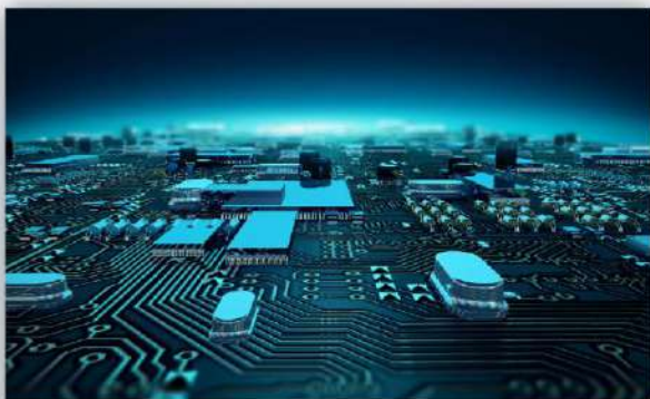
集成电路产业 集積回路産業

加强高端芯片设计、关键器件、核心装备材料等产业链关键环节，深化设计、制造、封装测试、装备和材料领域。