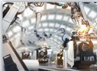
智能造 スマート製造

围绕发展大型客机、航空发动机, 聚焦装机配套、工装设备、发动机零部件、复合材料结构件制造 大型旅客機・航空エンジンを中心に、組立関連・工事設備・エンジン部品・複合材料の構造部品の製造に焦点を当てる