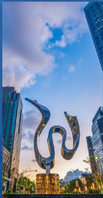
保税区贸易城 保税区貿易シティ