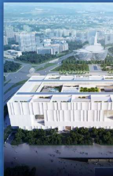
上海博物馆东馆 上海博物館東館