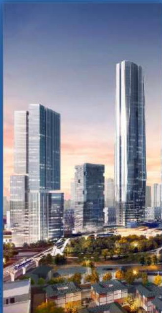
金桥智造城 金橋知的製造シティ