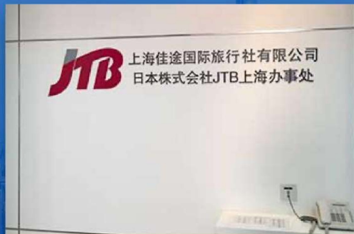
首家获得出境资质的日系旅行社上海佳途国际旅行社 初の出国業務資格を取った日系旅行会社 JTB上海佳途