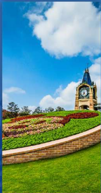
度假区旅游城 リゾート区観光シティ