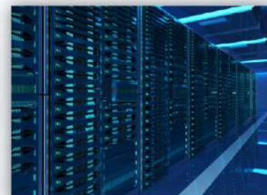
数据港 ソフトウェアと情報サービス

推动智能网联汽车多场景示范应用, 聚焦车路协同车联网, 加快推进智能网联汽车测试示范区建设 インテリジェントコネクテッドカーの多様な利用シーンにおけるモデルケースを生み出し、路車協調型コネクテッドカーに焦点を当て、インテリジェントコネクテッドカーのモデル試験エリアの整備を速める