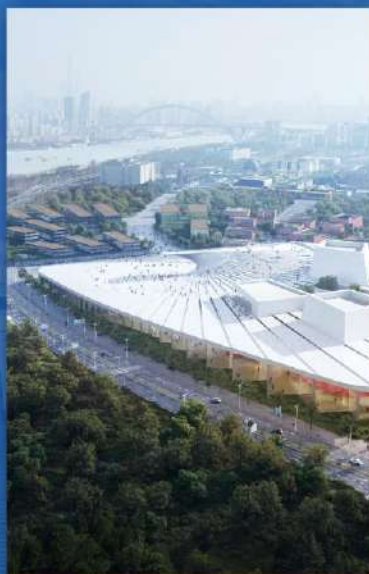
上海大歌剧院 上海グランド歌劇場