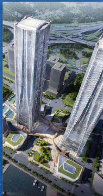
张江科学城 張江科学シティ