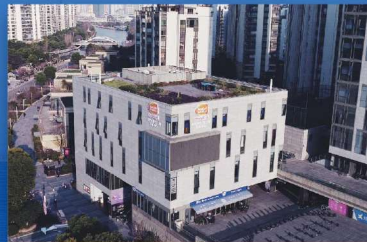
首家娱乐产业万代南梦宫 初の日系エンターテインメント企業 バンダイナムコ