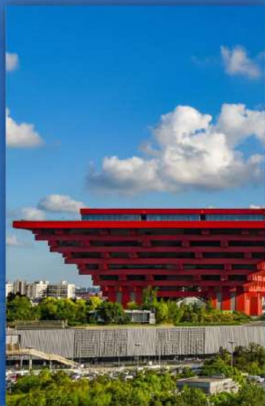
世博会中国馆 万博中国館