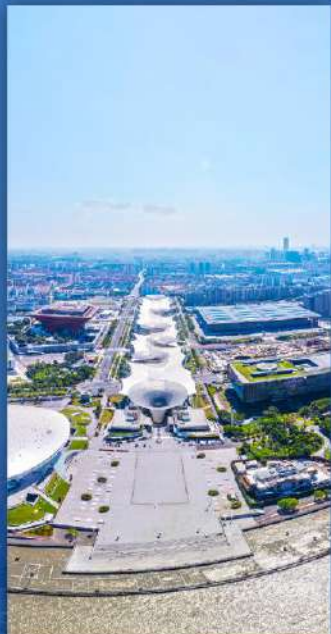
世博国际城 万博國際シティ