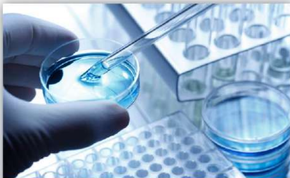
生物医药产业 バイオ医薬産業

ハイエンドチップ設計・キーパーツ・コア装備と材料など産業チェーンの重要プロセスを強化し、設計・製造・パッケージテスト・装備・材料などの分野に力を入れる