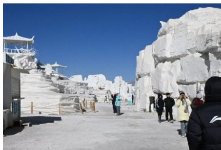
1 月のチャカ塩湖