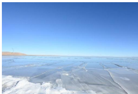
1 月の青海湖