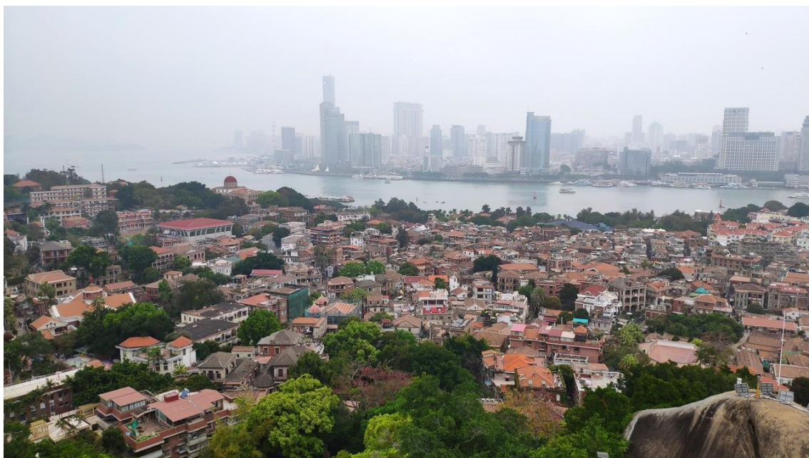
コロンス島から撮影したアモイ市街地の様子

時のヨーロッパの最先端の建築様式が融合したアモイ・デコ様式という独自の建築物が残されている。