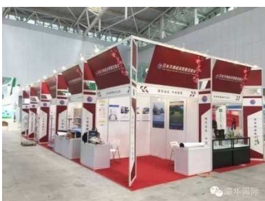
昨年日本ゾーンの全体図 (合計10コマ)