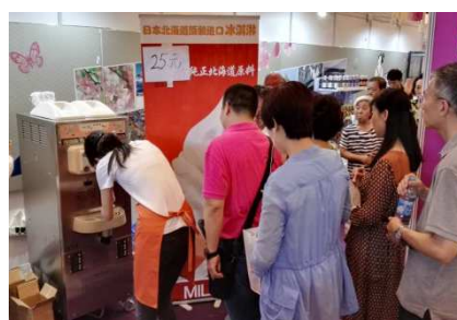
行列ができた日本食品のブース