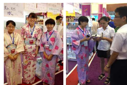
協力してきた天津外大のボランティア