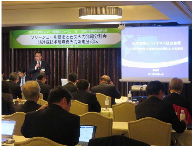
中日节能环保综合论坛煤电分会