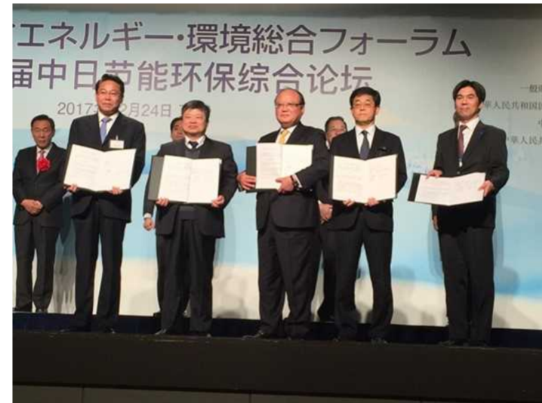
中日节能环保论坛签署合作协议书