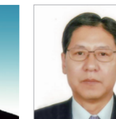
世耕 弘成 经济产业大臣 平木 大作 经济产业大臣政务官 中川 雅治 环境大臣 宗岡 正二 日中经济协会会长 张 勇 国家发展和改革委员会副主任 高 燕 商务部副部长 刘 少宾 中华人民共和国驻日本国大使馆临时代办