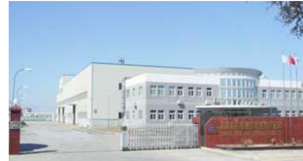
天津東邦鉛資源再生有限公司