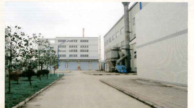
中天集团·长寿危险废弃物处置场