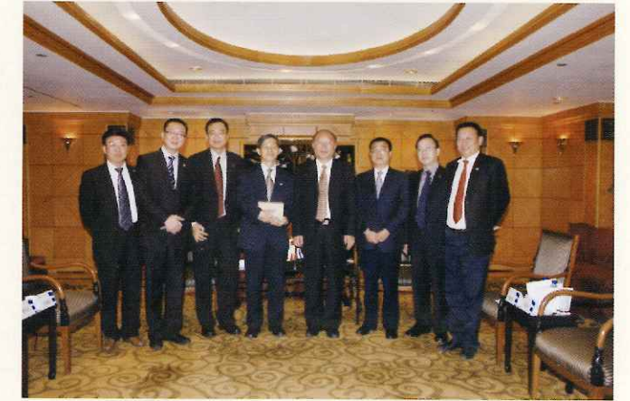
2008年在香港举行的重庆现代物流招商推荐会上，重庆市常务副市长黄奇帆、市发改委主任杨庆育等领导接见新加坡绿科控股集团主要高管，我港务物流集团领导和公司领导出席陪同。

公司凭借实力和信誉，笑迎天下客。目前公司战略合作伙伴有重庆钢铁股份有限公司、上海宝钢资源有限公司、新加坡绿科控股集团、中天环保产业集团有限公司等。公司将与各个合作伙伴紧密合作、共同打造重庆市再生资源物流航母，向着更加广阔的前景迈进！