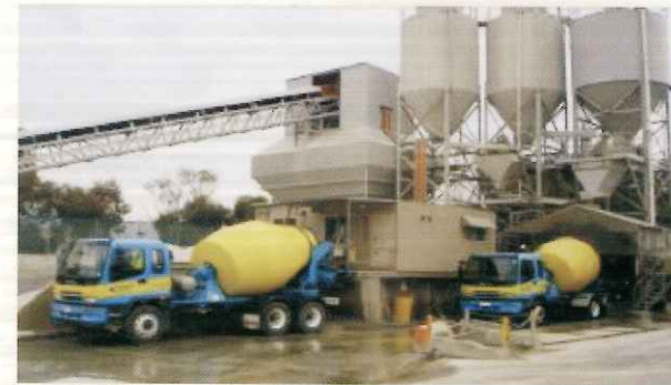
绿科控股集团生产场地一角